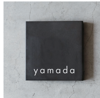
下/英語 ゴシック体