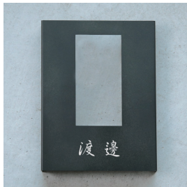
上開口/中央/日本語 行書体