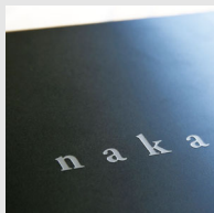
サンドブラスト加工

職人の手作業によって表面をたたいた槌目加工は、一点一点、表情が異なる。経年により鈍くすんだ色合いへと変化が楽しめる。