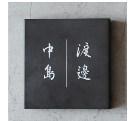
中央/日本語 行書体