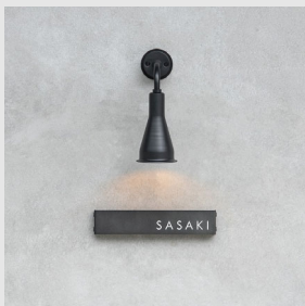
玄関灯 ブラック Holy