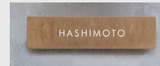
中央/英語 ゴシック体