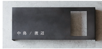
右開口/下/日本語 明朝体