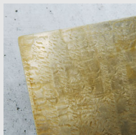
真鍮 槌目(つちめ)仕上げ

黒皮鉄の再現性にこだわり、均一ではなくかすかにムラのある色合いに。塗装仕上げなのでサビることなく、お手入れ不要。