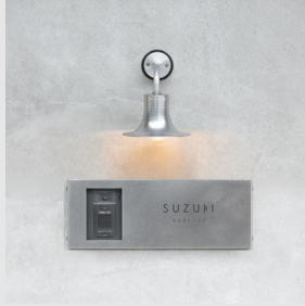
玄関灯 シルバー Bell