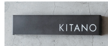
右/英語 ゴシック体