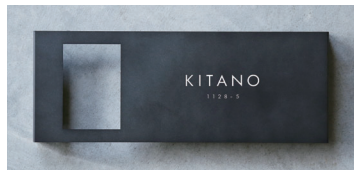
左開口/中央/英語 ゴシック体