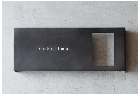
右開口/中央/英語 明朝体