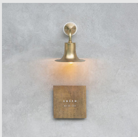
玄関灯 真鍮 Bell